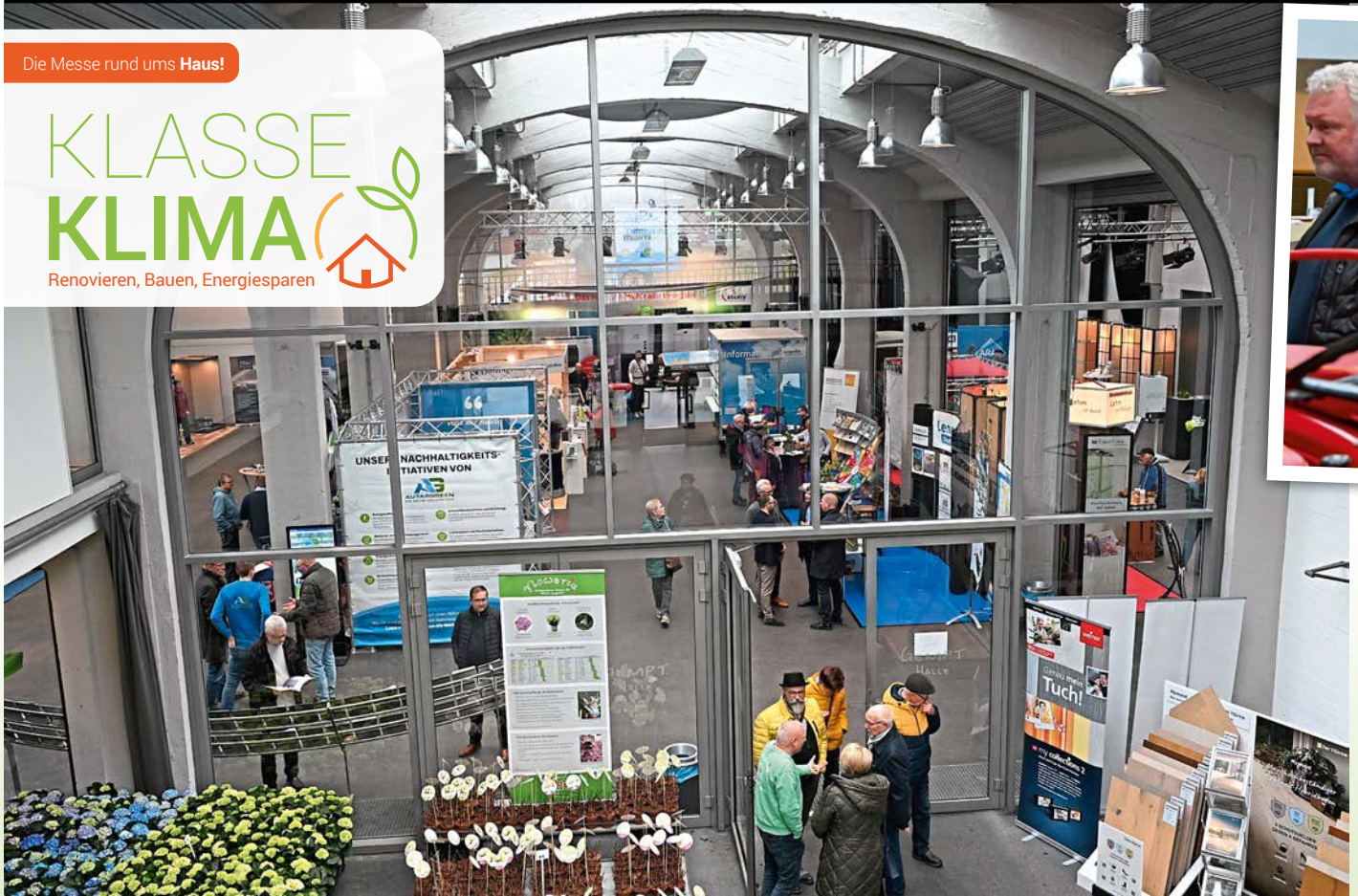
Volle Halle, großes Interesse: Zahlreiche Besucher informierten sich im vergangenen Jahr über moderne Lösungen rund ums Haus.

Messe „KlasseKlima“ zeigt am 7. und 8. März moderne Lösungen