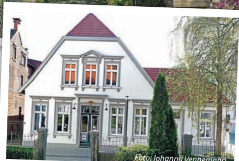
Das Alte Kontor.