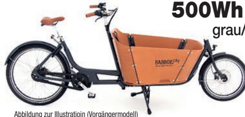
Abbildung zur Illustration (Vorgängermodell)

Elektrisches, zweirädriges Lastenrad mit moderner Tretunterstützung.